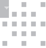
3815 ZONE DE CONFLUENCES