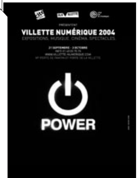
SURFACE TO AIR ©