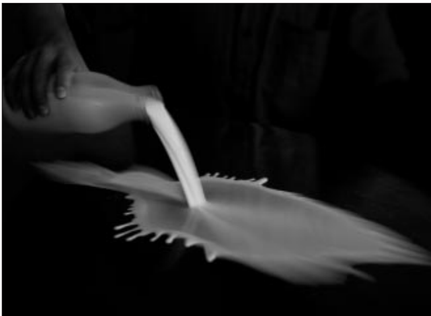
Le lait, 2000-2004