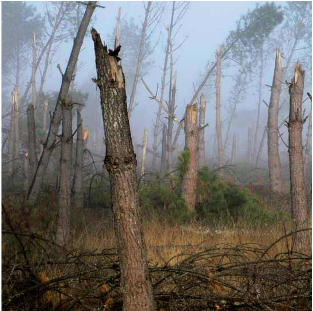
« Les Naou lagües », 8h45, Janvier 2010