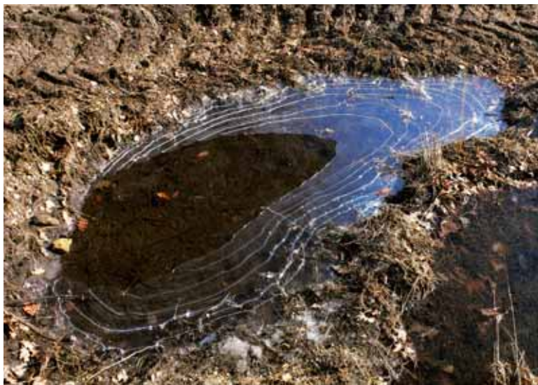
Flak, tirages photographiques sur papier brillant plastifiés et contrecollés sur dibon, 87x116 cm, route des Bourdettes, Sabres, Mars 2010, Patrick Polidano