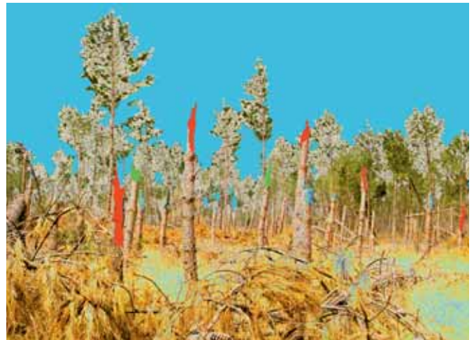
Naou lagües, impressions UV sur plaques de pin maritime, 66x88 cm, forêt des Naou lagües, Sabres, Mars 2010, travaux des élèves du LPA de Sabres