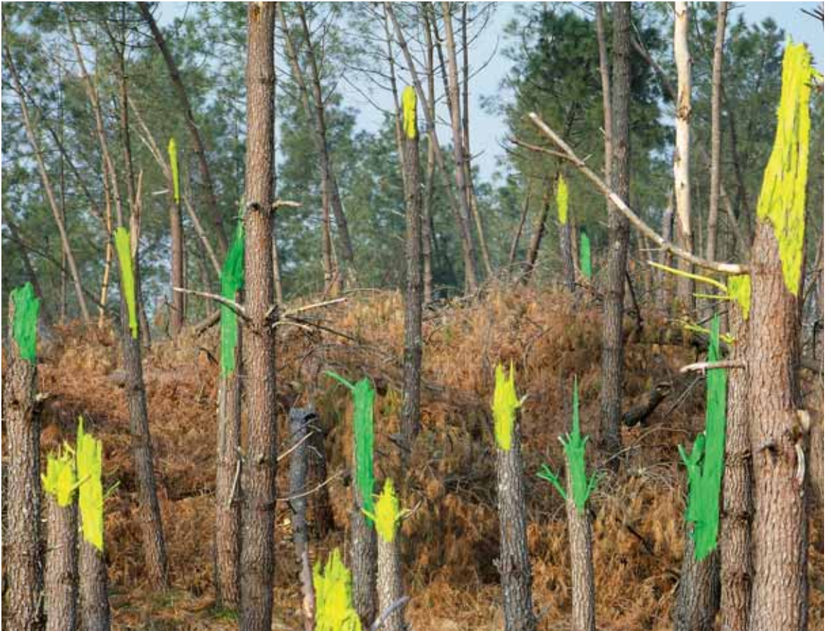
Marquage, impression UV sur plaque d'aluminium, 72x96 cm, forêt des Naou lagües, Sabres, Mars 2010, travaux des élèves du LPA de Sabres