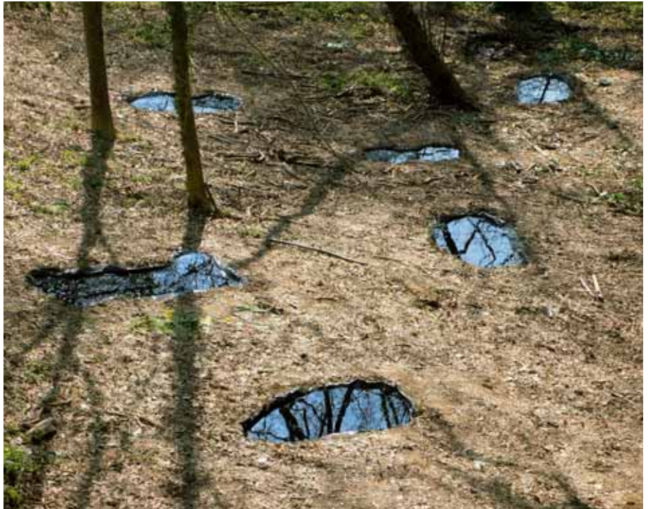
Flaque, impressions UV sur plaques d'aluminium, 27x36 cm, terrain de M me et M. Iparraguirre, Mugron, Mars 2010, travaux des élèves du LPA de Mugron