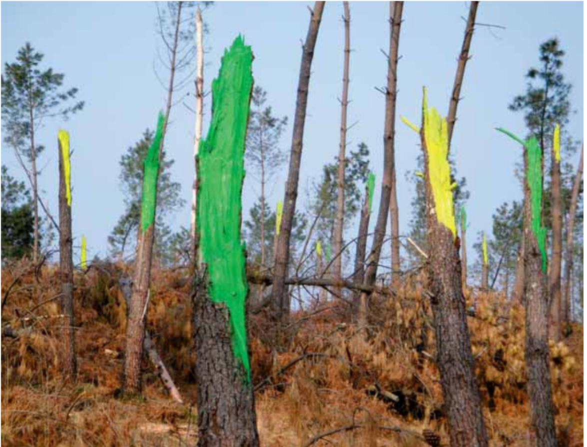
Marquage, impression UV sur plaque d'aluminium, 72x96 cm, forêt des Naou lagües, Sabres, Mars 2010, travaux des élèves du LPA de Sabres