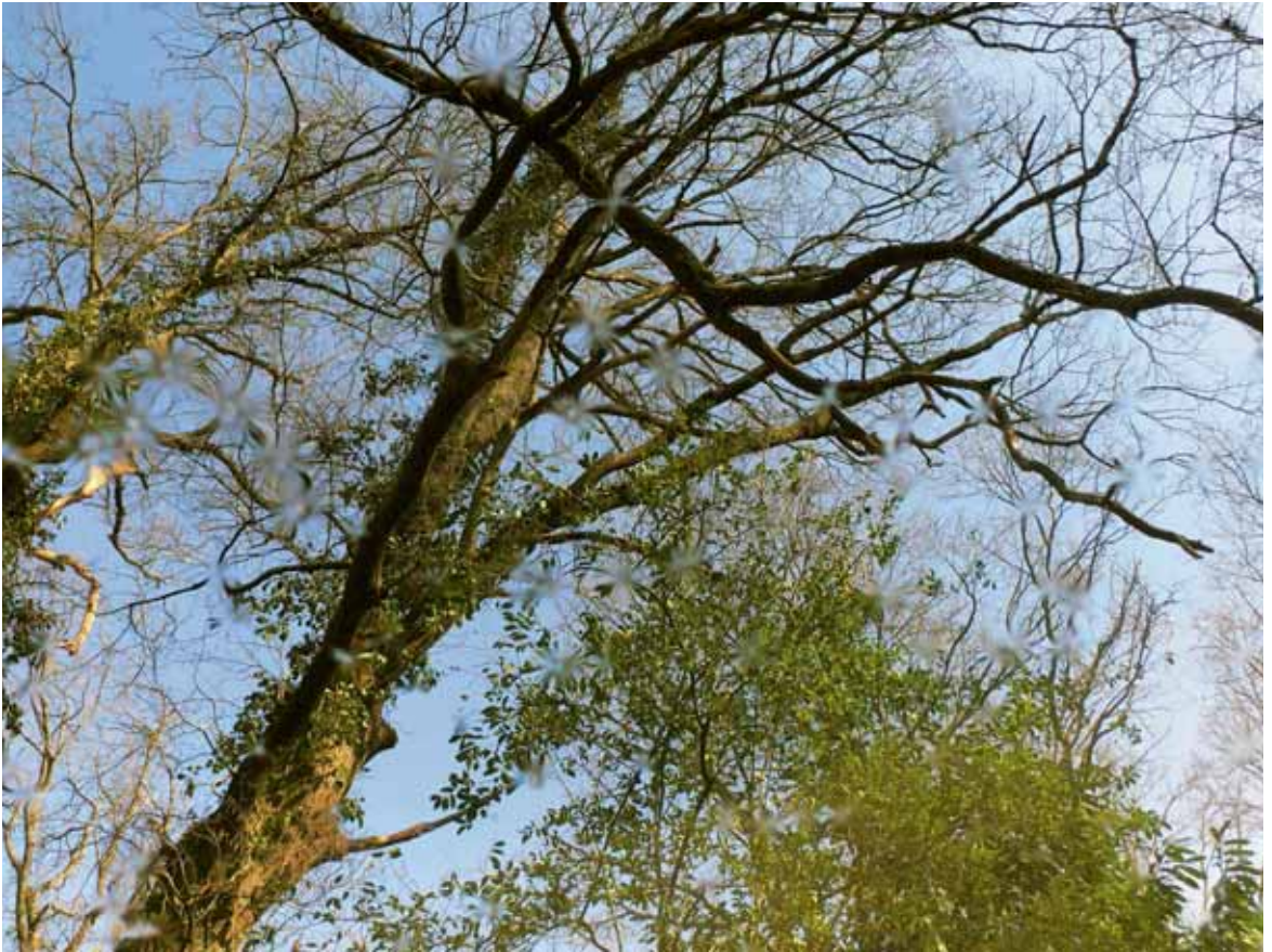
Flaque, impression UV sur plaque d'aluminium, 60x80 cm, terrain de M me et M. Iparraguiré, Mugron, Mars 2010, travaux des élèves du LPA de Mugron