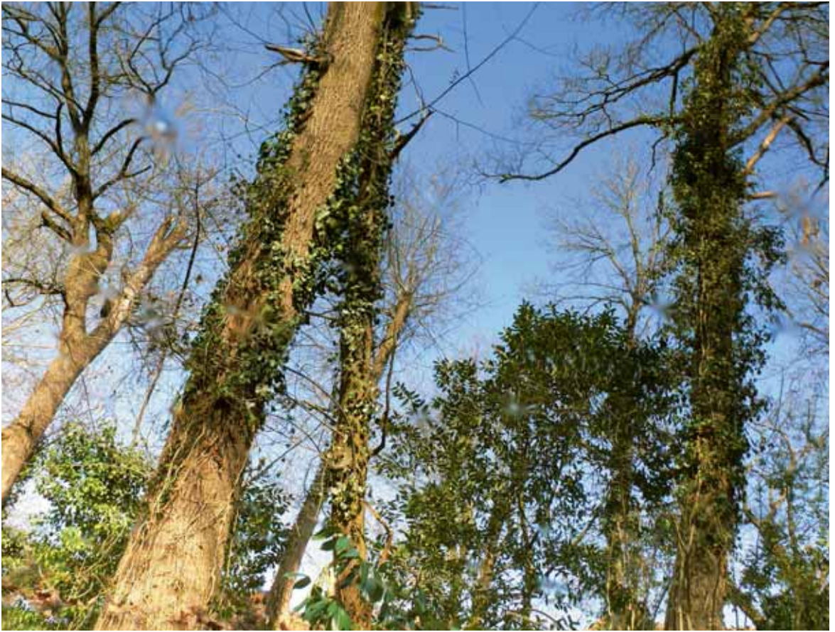
Flaque, impression UV sur plaque d'aluminium, 60x80 cm, terrain de M me et M. Iparraguire, Mugron, Mars 2010, travaux des élèves du LPA de Mugron