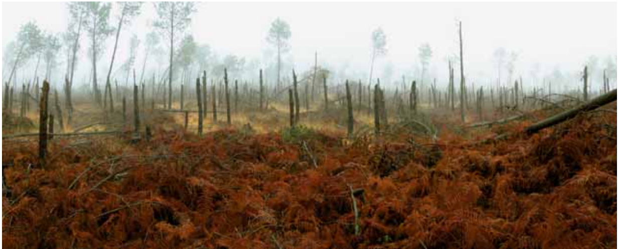
Klaus, impression UV sur plaque d'aluminium, tryptique 63x309 cm, La lande de Nahouns, Sabres, Janvier 2010, Patrick Polidano